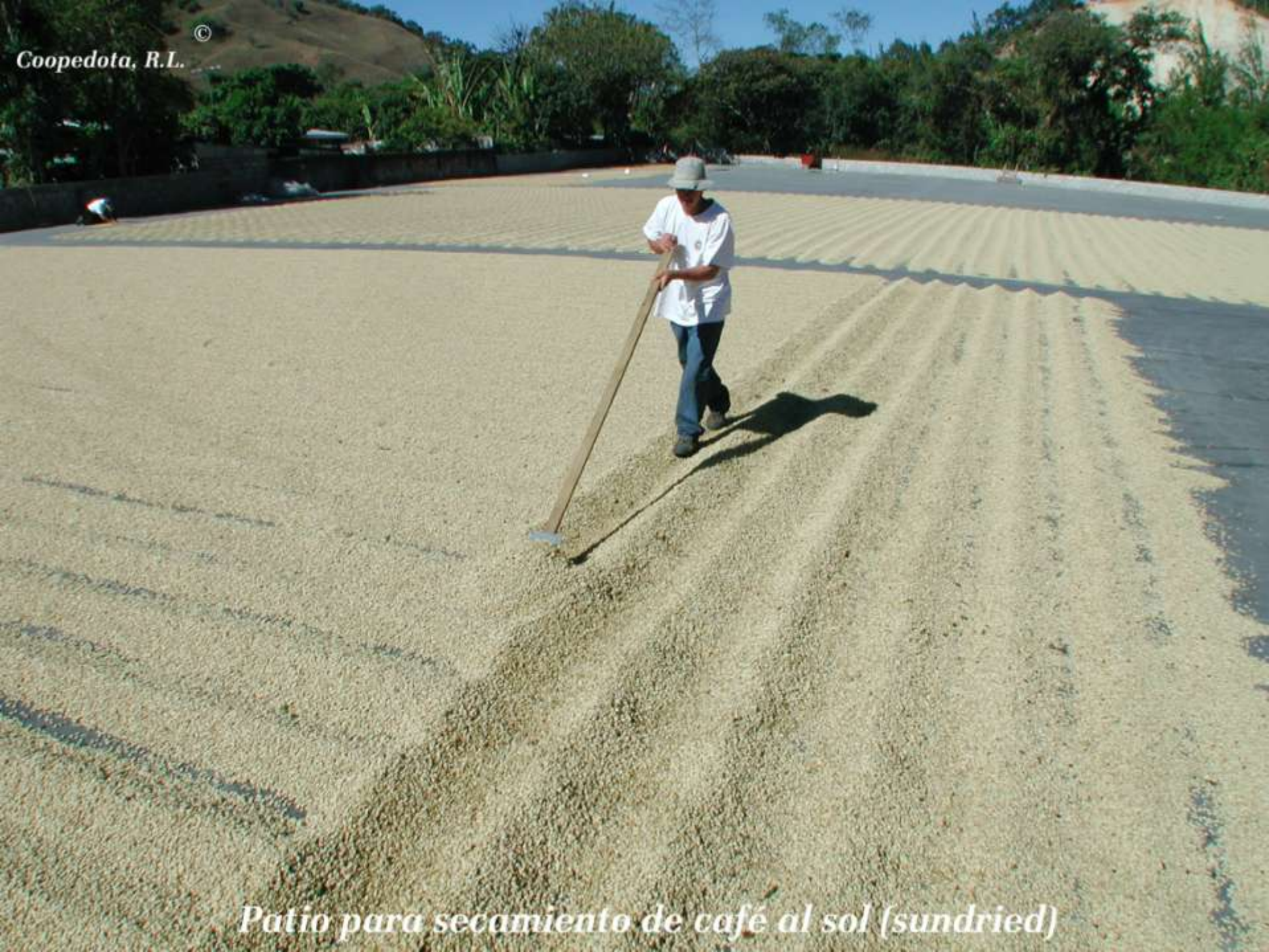
Patio para secamiento de café al sol (sundried)